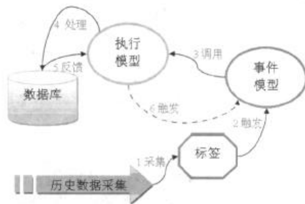
图5 业务流程处理模型

业务流程处理模型是对生产过程中生产活动的一种抽象描述,通过事件模型与执行模型协作完成,